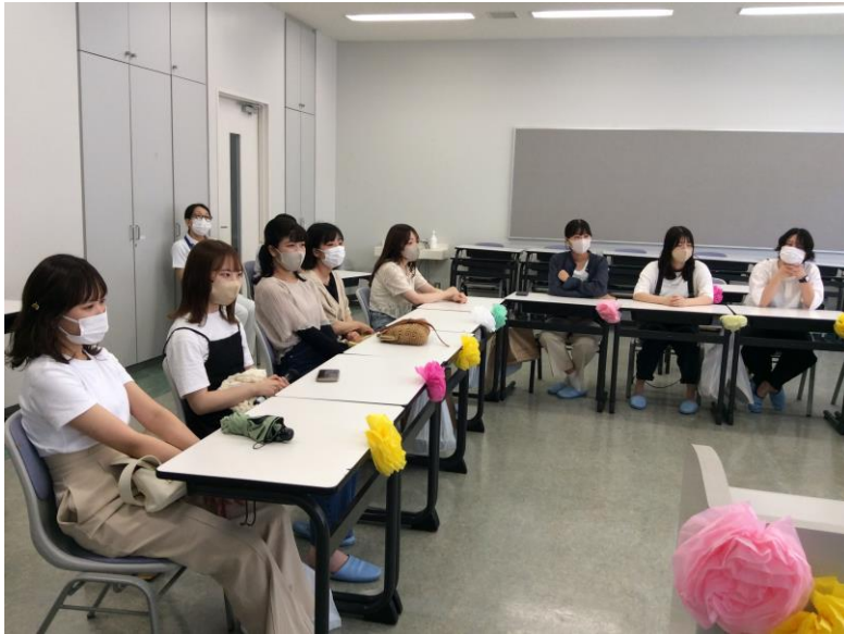
助産学科 卒業生の皆さん

令和5年7月17日（月・祝）、看護学科と助産学科の令和4年度卒業生をお迎えしてホームカミングデーを行いました。卒業生は新人看護師として、注射や採血、検査の介助等、できることが増えてきている一方、医療従事者としての責任についても語り合い、有意義な時間となりました。教職員一同、卒業生の活躍を祈っています！