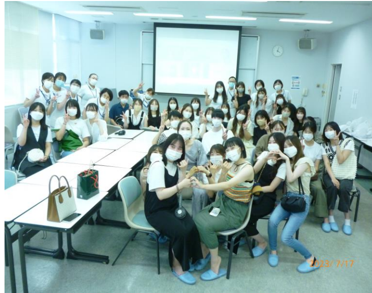
看護学科 卒業生の皆さん