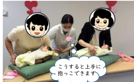
抱っこやオムツ交換のロールプレイ