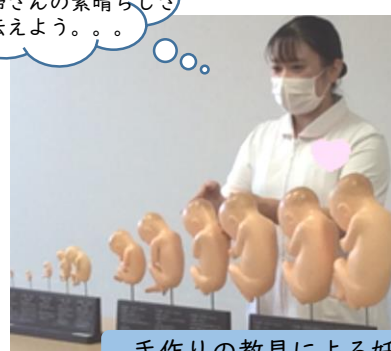
手作りの教具による妊娠・分娩・産後のお話