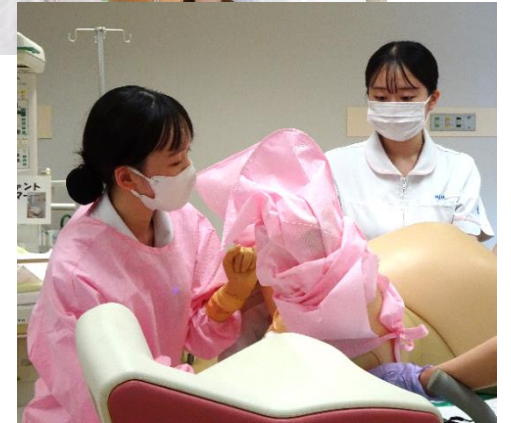
分娩介助技術に磨きをかけます！