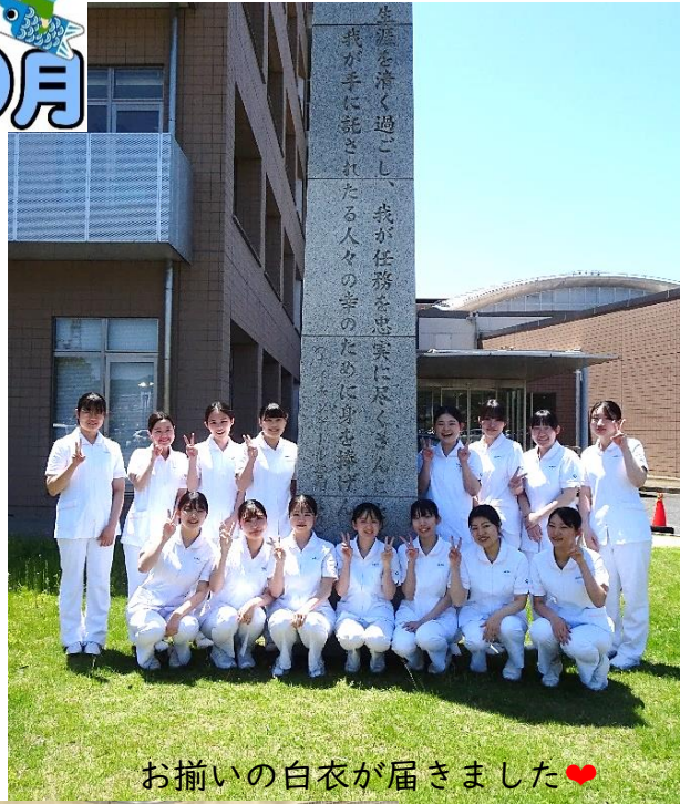
お揃いの白衣が届きました❤️