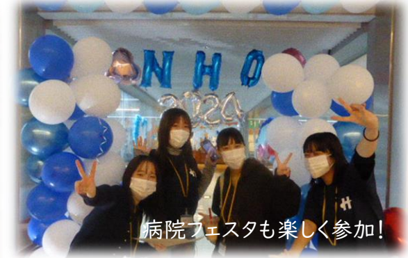
病院フェスタも楽しく参加!