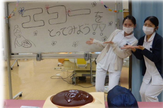
迷路を とってみよう!