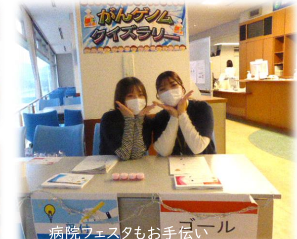
病院フェスタもお手伝い