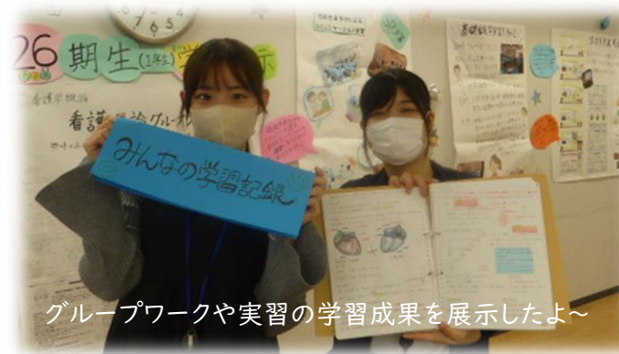
グループワークや実習の学習成果を展示したよ～