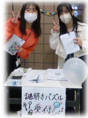
謎解きパズル 受付