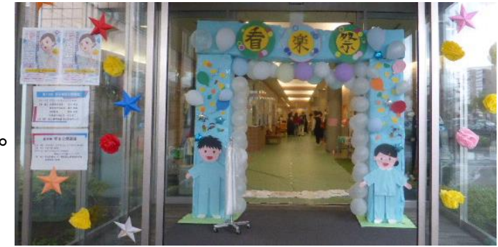
来校者 約460名 ♡ ご参加ありがとうございました

「看学祭～笑顔で繋がろう～」をテーマに、令和6年11月2日（土）学生祭を開催しました。大雨にもかかわらず、地域の皆さまをはじめ、病院職員・保護者・友人等、多くの皆さまが岡山看護助産学校に来てくださり、趣向を凝らして企画・準備をした私達自身もとても楽しい時間を共に過ごすことができました。今回の企画力・実行力・協調性を今後の臨地実習に活かしていきたいです。