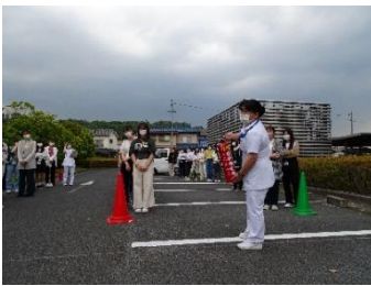
教員によるレクチャー