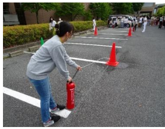
学生による消火訓練