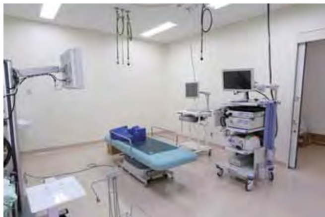
■ 外来内視鏡センター