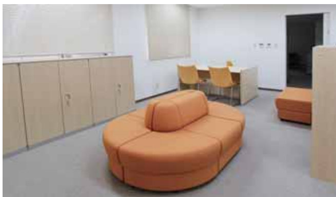
■ がん相談支援センター