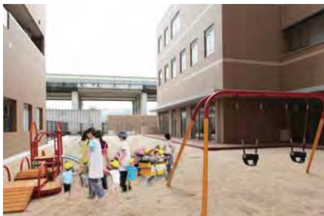
■ 保育所 くるみ園