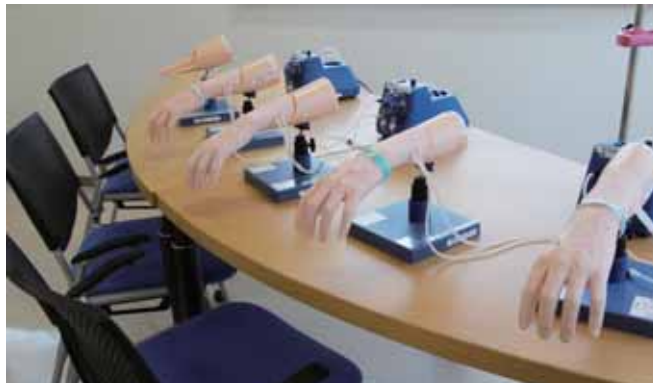
■ スキルアップラボ