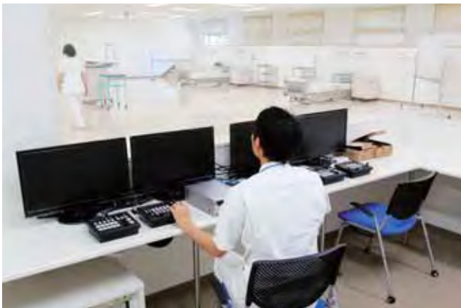
■ ホスピタルスタジオ