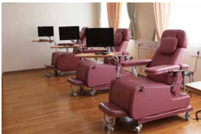
■ 外来化学療法センター