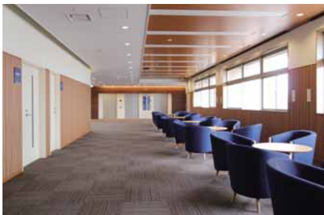
■ 大研修室前ラウンジ