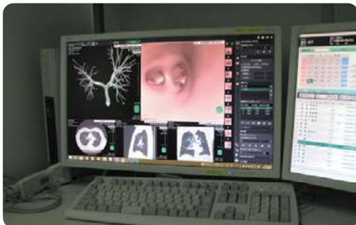
仮想気管支内視鏡

全身麻酔下に硬性気管支鏡を用いて、気道狭窄に対するシリコンステント挿入や腫瘍・肉芽に対する焼灼などの高度な手技を行っています。中国・四国地方では当院を含め数施設で行っていません。