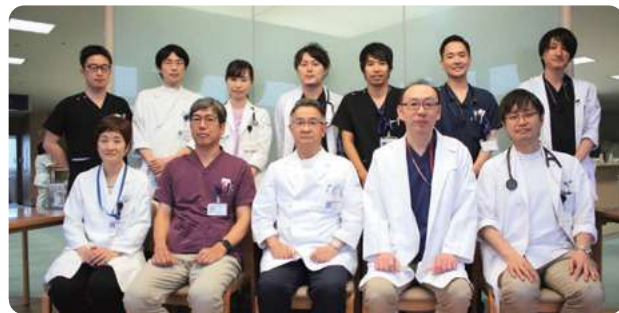
呼吸器内科スタッフの面々